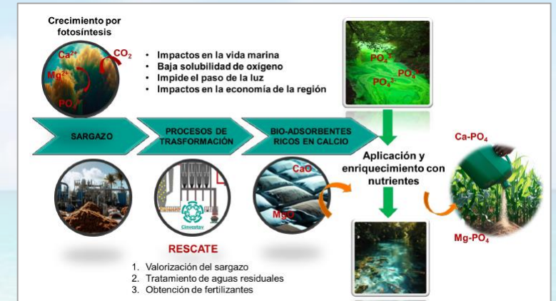
Transformación del sargazo para la remediación de aguas residuales y enmienda de suelos: estrategias en un modelo de economía circular (RESCATE).