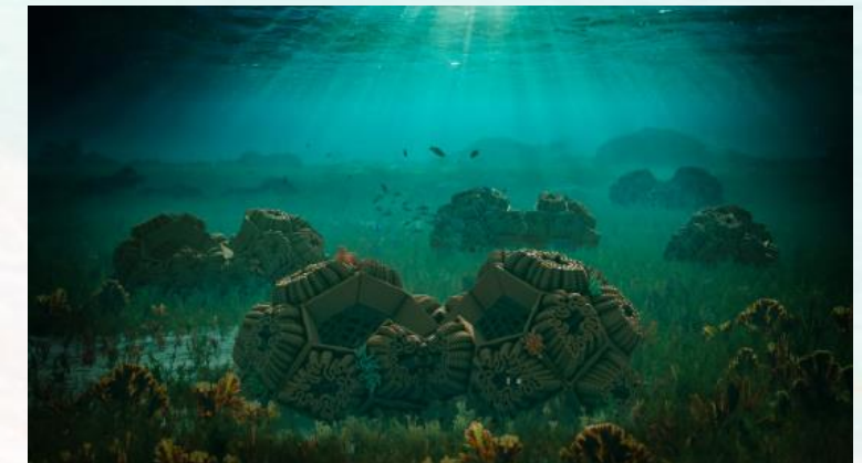
Impresión 3D de corales artificiales: sustratos biomiméticos a partir de la biomasa de sargazo.