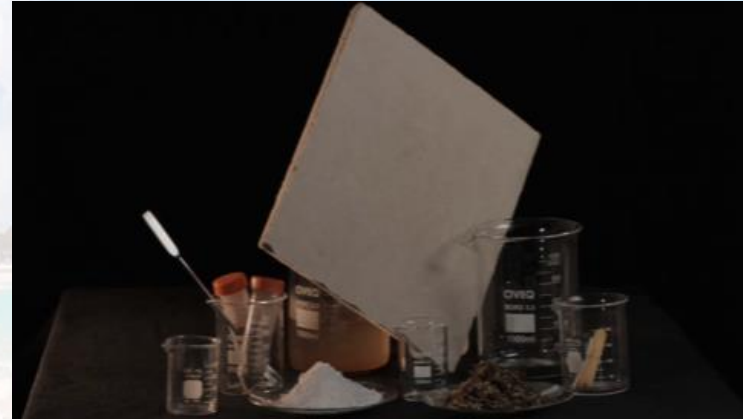
Tratamiento y valorización del sargazo en un modelo de economía circular para la fabricación de paneles en la construcción sostenible (SARGAPANEL).